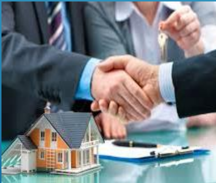
ACUERDO DE PROMOCIÓN