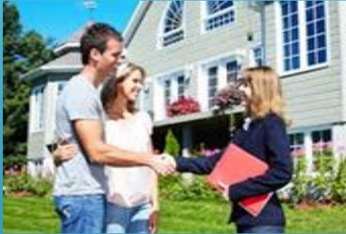
VISITA DEL EXPERTO