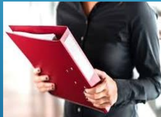
RECOPIACIÓN DE DOCUMENTOS