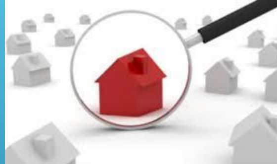
ESTUDIO DE MERCADO