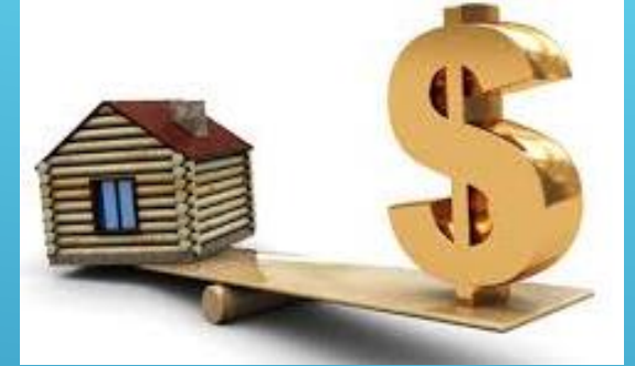
PROPUESTA DE VALOR